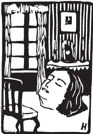
«פְּנִים», תחריט מאת צבי גולן בירחון «שבתאי», מרץ 1912

גולן על מוצאו. הוא אמר כי תמיד הרגיש שאשה זו אינה אמו, לא סלח למשפחתו על שעזבה אותו ולא חידש את הקשר עימם 4 .