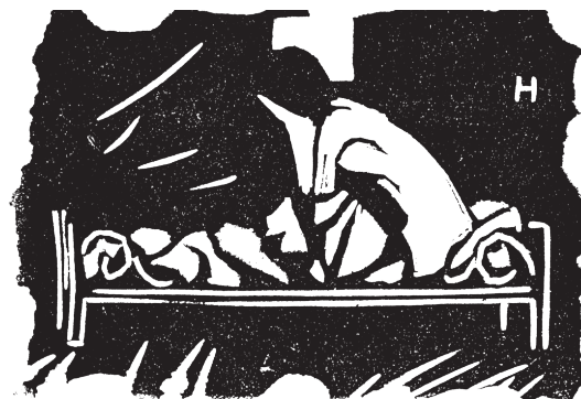
«מיטת נערה», תחרית מאת צבי גולן בירחון «שבתאי», ספטמבר 1913

הרכבת, לאה לא זיהתה אותו. הוא אמר שלעולם כזה לא יביא ילדים, ואמנם בני הזוג נפטרו עריריים. בתעודת העלייה שקיבל ביום 17.1.1939 נרשם מקצועו "למדן".